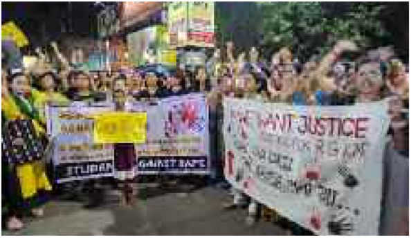
কলেজ ছাত্র ছাত্রীদের উদ্যোগে যুবকার সন্ধ্যায় সিডিডি বাসস্ট্যান্ডে আরজি কর কাতের প্রতিবাদে অবস্থান বিক্ষোভ

নিজস্ব প্রতিবেদন, বাকুড়া: আরজি করা কাতের মাঝেই এবার গাডি আদালতের মহিলা বিচারকের গাডি আটকে তাঁকে উদ্দেশ করে গালিগালাজ ও কুৎসিত অঙ্গভঙ্গির অভিযোগ উঠল দুই যুবকের