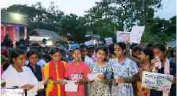
অব্যাহত প্রতিবাদ। বীরভূমের সাঁইথিয়া বিধানসভার অন্তর্গত মাঠপলসা এবং দাদমা অঞ্চলের মারিগালা, গুন্ডিয়া, খান্দারতারা গ্রামে আরজি কর ঘটনার পরিবেশ্চক্তিতে প্রতিবাদ ও বিক্ষোভ মিছিলে ছাত্র-ছাত্রী ও সাধারণ মানুষ।